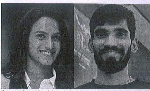
four years in an endorsement deal worth $50 crore and